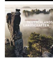
„Deutschlands Landschaften“ von Berthold Steinhilber ist bei Frederking & Thaler erschienen (240 Seiten, ca. 200 Abbildungen; 49,99 Euro; frederking-thaler.de). Deutschlands Landschaften by Berthold Steinhilber (currently in German only) has 240 pages, approx. 200 color plates and costs 49.99 euros; frederking-thaler.de

Steinhilber's best work has now been published in a fascinating book. Many of his photographs look like paintings of, for example, the Danube river resembling a silver ribbon as it meanders through an enchanted land; the open-pit lignite mines of eastern Germany's Lower Lusatia that recall the Namib Desert in western Africa, and Neuschwanstein Castle shimmering mystically in the evening light and in its mirror image in the lake. "I wanted to leave a trail that would inspire people's curiosity to discover what is hidden and to make them aware of the wonders of nature right there on their doorstep," says Steinhilber, who has undoubtedly accomplished his task. His photographs take you on a virtual tour of Germany's most spectacular natural scenery and awaken the desire to see it for yourself. ■