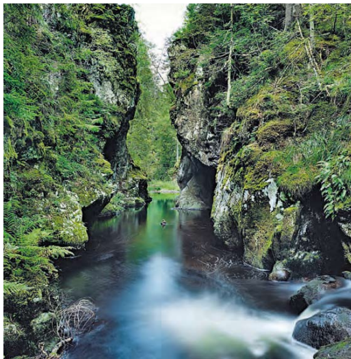
Extreme: Der Tagebau Welzow-Süd in der Niederlausitz schuf eine bizarre Wüstenlandschaft; in der Wutachschlucht (Hochschwarzwald) wuchern Moos und Farne Desert sands cover the former Welzow-Süd lignite mine in Lower Lusatia; moss and ferns grow in the Wutach Gorge in the Black Forest

E s ist nicht ganz einfach, in Deutschland unberührte Natur zu finden. Mehr als 80 Millionen Menschen leben in diesem Land, im Schnitt verteilen sich 230 Einwohner auf einen Quadratkilometer. Diese hoch entwickelte Gesellschaft ist auf Wachstum ausgerichtet, und das braucht Platz, Energie, Bodenschätze. Während stetig große Flächen durch Städte und Dörfer versiegelt worden sind, hat die industrielle Landwirtschaft immer mehr Monokulturen hervorgebracht. Straßen und Autobahnen, Fabriken und Industriegebiete lassen die Naturräume weiter schrumpfen. Alles richtig, einerseits. Andererseits kann sich die Natur in vielen geschützten Räumen weitgehend frei entfalten: Deutschland hat allein 14 Nationalparks, deren Fläche insgesamt rund 2000 Quadratkilometer beträgt, viermal so groß wie der Bodensee. Dazu kommen etwa 8500 Naturschutz- und 7500 Landschaftsschutzgebiete, 103 Naturparks, 16 Biosphärenreservate und mehr als 70 Geotope.